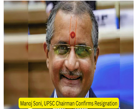
Manoj Soni, UPSC Chairman Confirms Resignation

(C) यूपीएससी के अध्यक्ष मनोज सोनी ने अलग-अलग पदों पर रहकर अपना पद छोड़ा है। सोनी का इस्तीफा अभी तक स्वीकार नहीं किया गया है। संघ लोक सेवा आयोग के अध्यक्ष ने अपना पद पांच साल पहले छोड़ा था और एक साल बाद पद संभाला है। उनका कार्यकाल 2029 में समाप्त होगा। 59 वर्षीय मनोज सोनी क्रेडिट के महाराजा सयाजीराव विश्वविद्यालय के पूर्व छात्रा है।