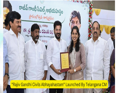
"Rajiv Gandhi Civils Abhayahastam" Launched By Telangana CM

(D) तेलंगाना के मुख्यमंत्री ए.रेवंत रेड्डी द्वारा तेलंगाना के सिविल सेवा उम्मीदवारों को वित्तीय सहायता प्रदान करने के लिए एक अनूठा कार्यक्रम शुरू किया गया। इस कार्यक्रम के तहत, मुख्य परीक्षा उत्तीर्ण करने वाले उम्मीदवारों को उनकी तैयारी के लिए 1 लाख मिलेंगे। राजीव गांधी सिविल्स अभयहस्तम नामक योजना तेलंगाना क्षेत्र के लगभग 400 उम्मीदवारों के लिए सहायक होगी जो हर साल मुख्य परीक्षा के लिए अर्हता प्राप्त करते हैं।